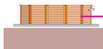
Hors-sol* Uniquement avec Kit jambage en option