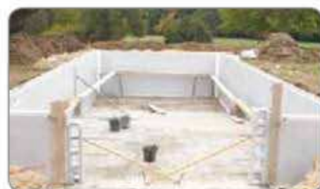
k Structure avec emplacement pour escalier