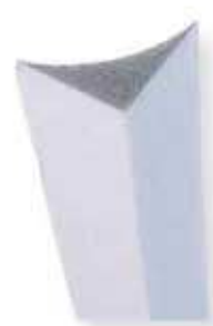
e Angle intérieur rayon 15cm