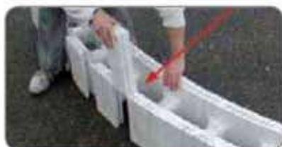
j Bloc courbe à cintrer avec entretoises polystyrène (pour escalier)