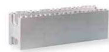
a Bloc standard