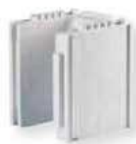
c Bloc d'adaptation 25cm