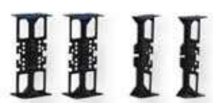
f Bloc courbe pré-cintré avec entretoises plastique (pour escalier)