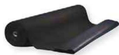
h Feutrine spéciale Styrlux