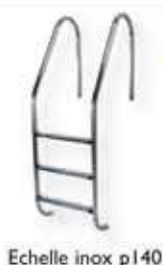
Echelle inox p140