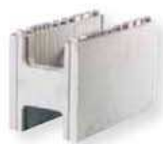
d Bloc d'adaptation 50cm