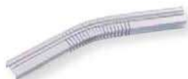
g Rail hung en U rayon 15cm