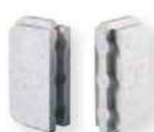
b Bouchons d'extrémité