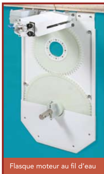
Flasque moteur au fil d'eau

Un enfant se noie en moins de trois minutes ; aucun type de protection ne remplacera jamais la surveillance et la vigilance d'un adulte responsable.