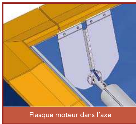
Flasque moteur dans l'axe

Un enfant se noie en moins de trois minutes ; aucun type de protection ne remplacera jamais la surveillance et la vigilance d'un adulte responsable.