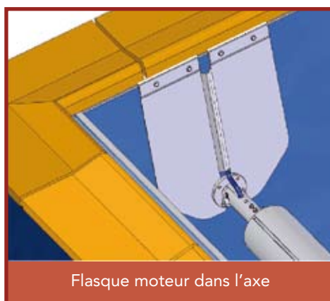
Flasque moteur dans l'axe

Un enfant se noie en moins de trois minutes ; aucun type de protection ne remplacera jamais la surveillance et la vigilance d'un adulte responsable.