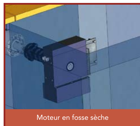
Moteur en fosse sèche