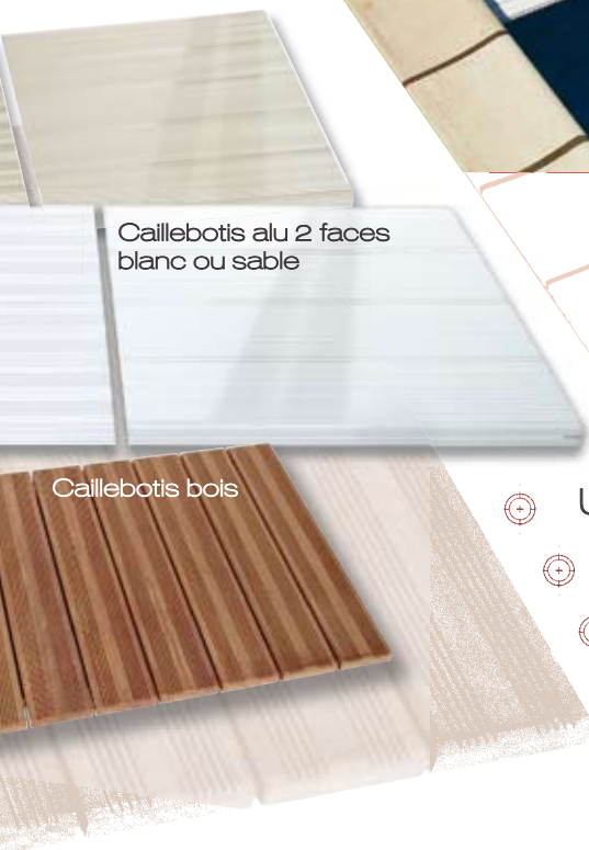
Caillebotis alu 2 faces blanc ou sable