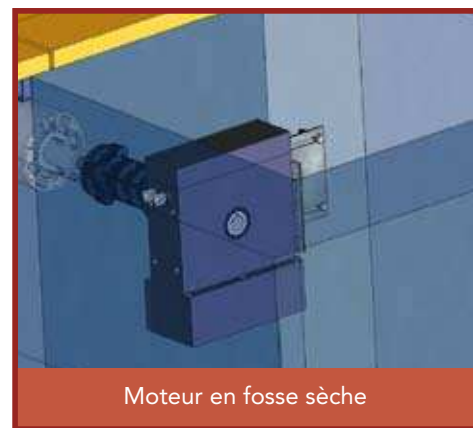
Moteur en fosse sèche