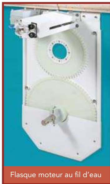
Flasque moteur au fil d'eau

Un enfant se noie en moins de trois minutes ; aucun type de protection ne remplacera jamais la surveillance et la vigilance d'un adulte responsable.