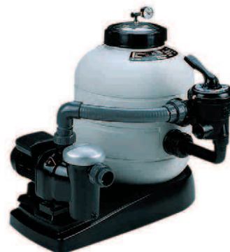
Monobloc lateral Side-mount monobloc