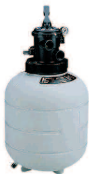
Filtre Top Top-mount filter