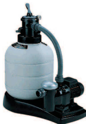
Monobloc Top Top-mount monobloc