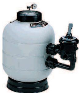
Filtre lateral Side-mount filter